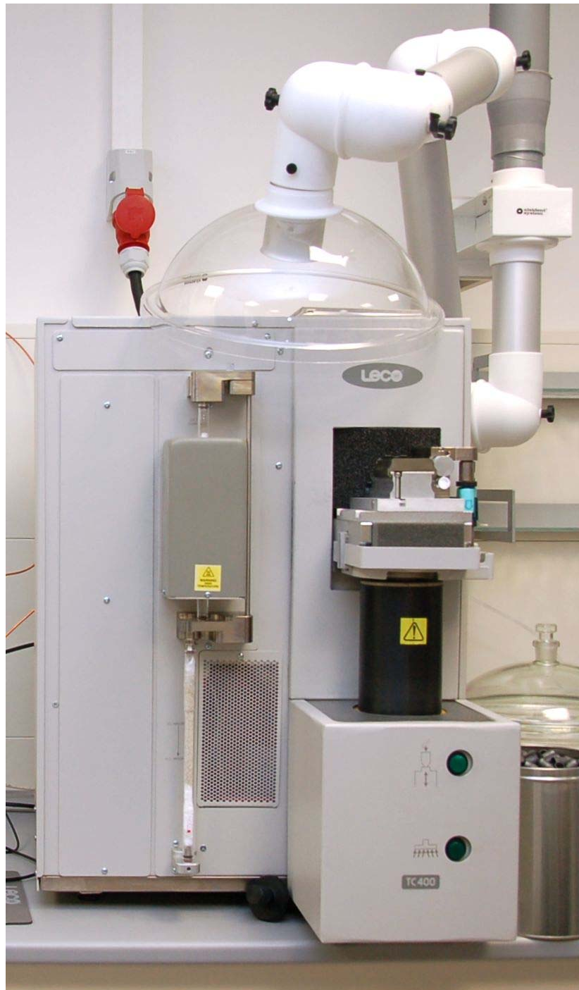
1: LECO TC 400, N-/O-Analysator