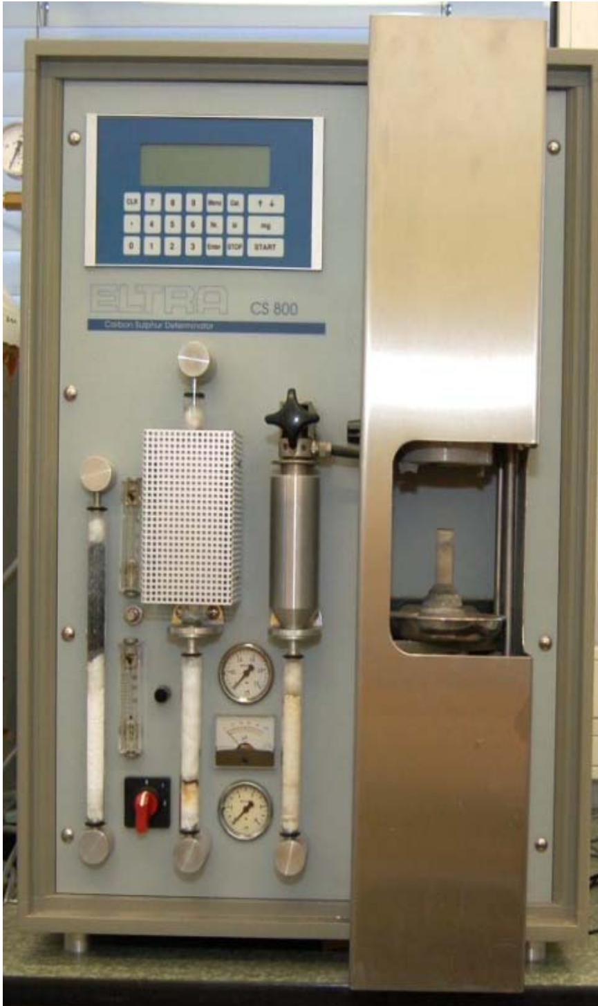
2: ELTRA CS 800, C-/S-Analysator