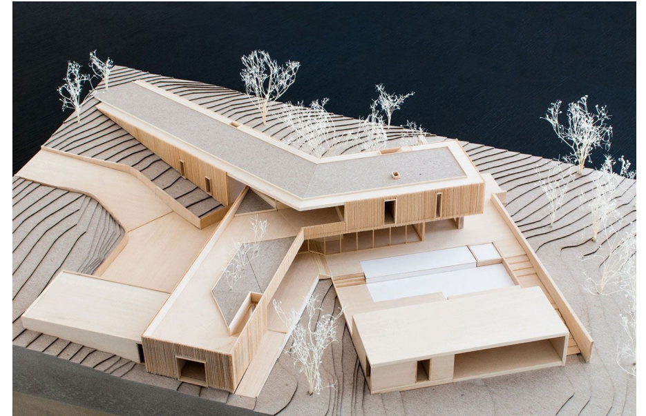
Abb: beispielhafte Projektgröße

_ div. Teilaufgaben erstellen für einen erfolgreichen Projektablauf