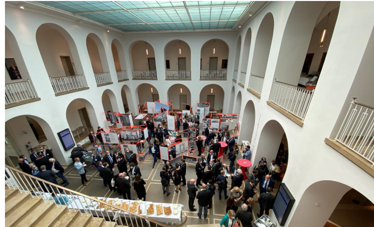
Das LWL-Führungskräfteforum im Landeshaus.