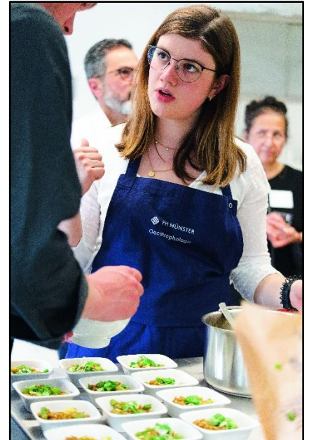
Mit Hilfe von Workshops der FH Münster können Sie den Einstieg in eine nachhaltige Außer-Haus-Verpflegung schaffen.

Ansprechpartnerinnen für die Workshops der FH Münster sind