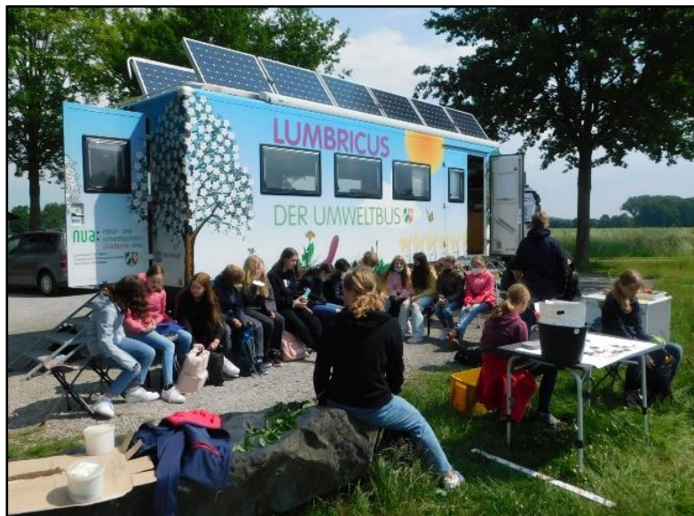
Schulklassen können den rollenden Umweltbus kostenlos einladen.

Die umfangreiche Ausstattung des Umweltbusses ermöglicht praxisnahes Arbeiten, beispielsweise zum Thema Artenvielfalt und zu Lärmemissionen.